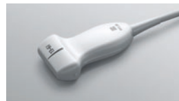
HFL38xi ●● 13-6 MHz Linéaire