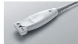
L25x ●●● 13-6 MHz Linéaire