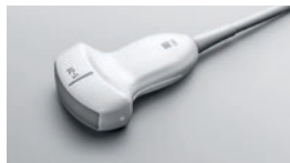
rC60xi ●●● 5-2 MHz Convexe