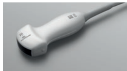
C35x ● 8-3 MHz Convexe

SonoSite développe, fabrique et teste en interne des sondes adaptées aux besoins réels de ses clients. Nos sondes répondent aux spécifications militaires extrêmement contraignantes, en particulier en matière d'impact. Elles sont conçues pour résister aux chocs et aux chutes, très fréquents en milieu vétérinaire.