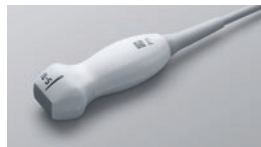
rP19x ●● 5-1 MHz Phased