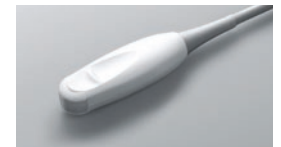
C11x ● 8-5 MHz Convexe