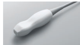
P10x ● 8-4 MHz Phased