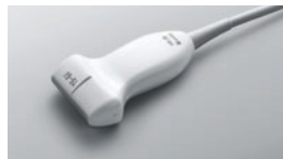
HFL50x ● 15-6 MHz Linéaire